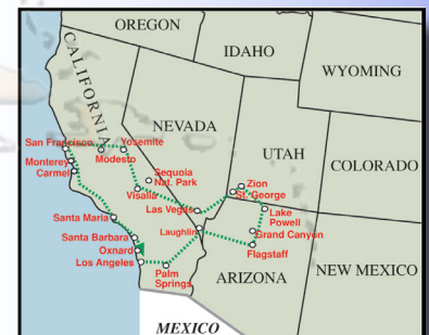
L'OUEST AMÉRICAIN ÉCONOMIQUE (14 jours)