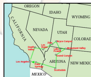
LES "LODGES" DU SUD-OUEST AMÉRICAIN (15 jours)