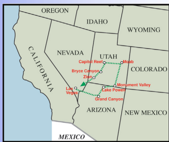
AVENTURE DANS LES PARCS NATIONAUX (12 jours)