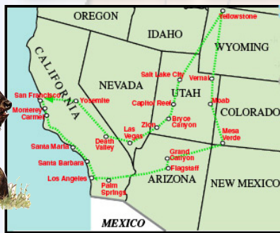
GRAND TOUR DE L'OUEST AMÉRICAIN (22 jours)