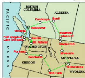
LE NORD-OUEST DU PACIFIQUE (22 jours)