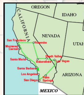
CALIFORNIE ET LE NEVADA SIGNÉS BEST WESTERN (13 jours)