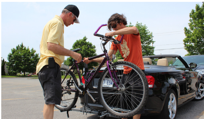
Accueil des donateurs de vélo