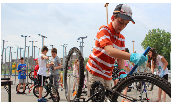
Préparation des vélos