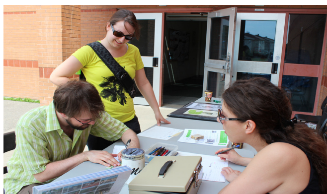
Émission des reçus